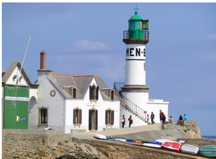
Photo : Le phare de l'île de Sein

Le lendemain, visite du petit musée de la Société des sauvetages en mer (SNSM) (naufages et sauvetages ayant depuis fort longtemps marqués la vie des Sénans) et ascension du phare d'où ils admirent le magnifique panorama de l'île et de la chaussée de Sein...