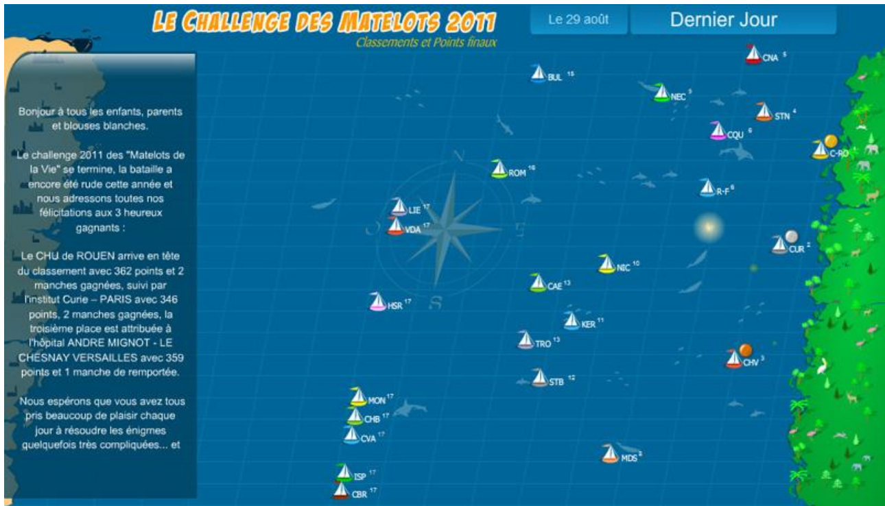
Photo : Le relevé de points de chaque hôpital symbolisé par un voilier virtuel

L'Hôpital ANDRE MIGNOT - LE CHESNAY VERSAILLES obtient la troisième place avec 359 points & 1 manche.