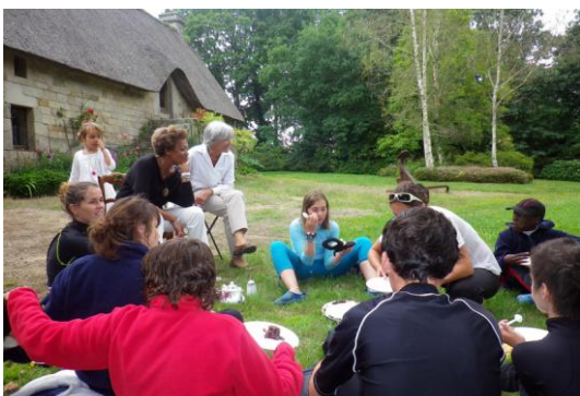
Photo : Goûter et discussions autour d'Eric Tabarly

La journée se termine sur la plage autour de grillades face à la mer. Le début du bonheur !!!