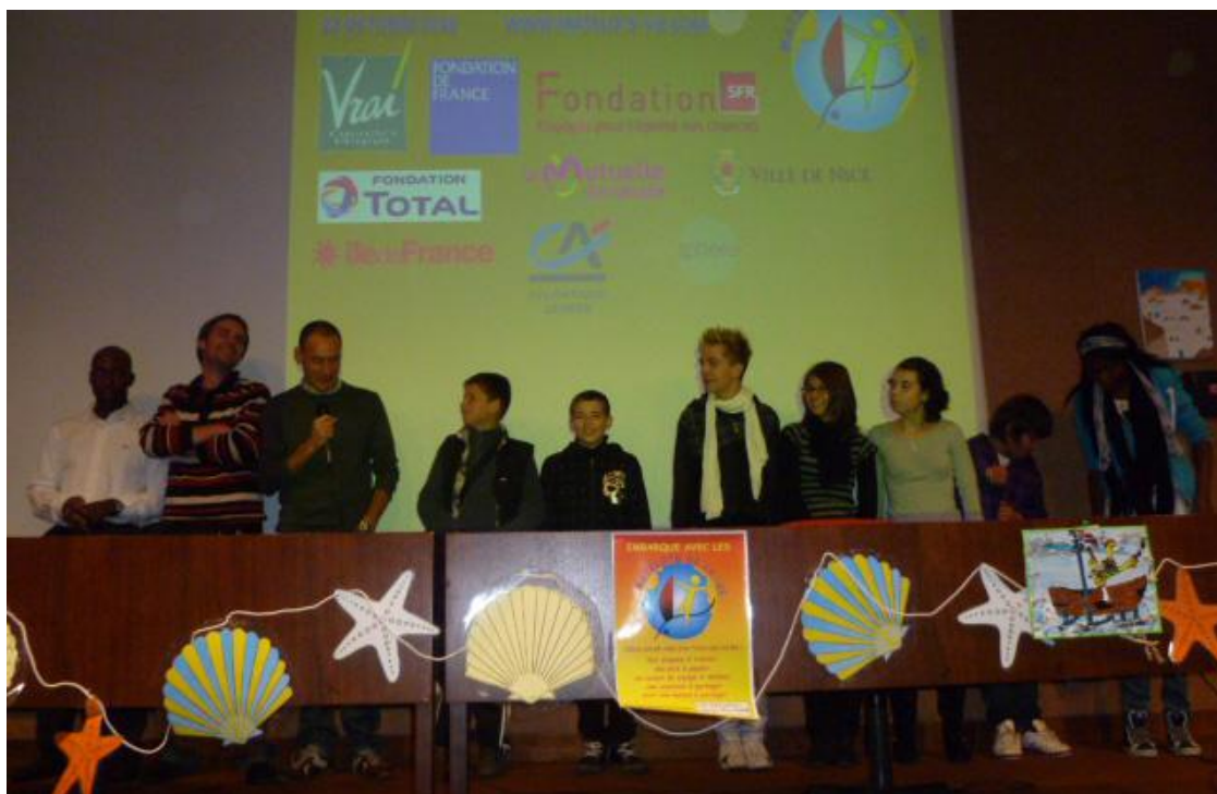
Photo issue de la conférence des Matelots de la Vie 2010