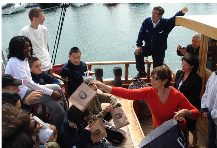
Photo : Les matelots & les cadeaux offerts par la Mairie de Saint-Quay-Portrieux