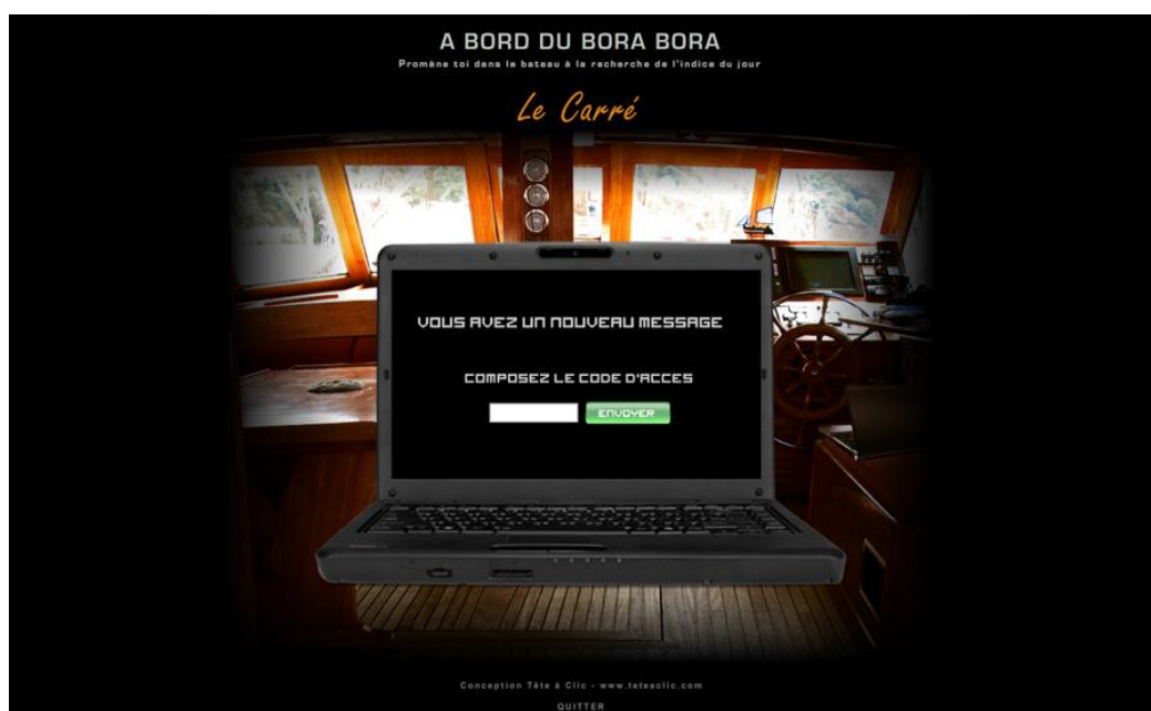
Photo : Un aperçu d'un jeu d'observation, énigme basée sur le voilier Bora Bora

Parents, amis et blouses blanches et même les chefs de service, tous étaient mis à contribution, car pas question de perdre des points, le classement journalier sur le site sanctionnait les mauvaises réponses !