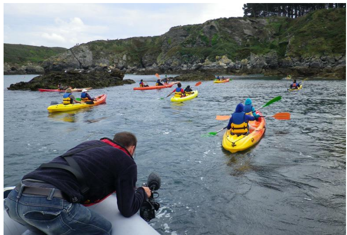
Photo : Les Matelots longent la côte est de Belle Ile