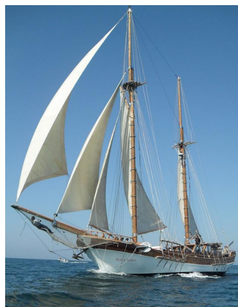
Photo : Le voilier Bora Bora

L'occasion de faire connaissance, entre eux et avec les adultes qui les encadreront lors des expéditions, de découvrir le voilier « Bora Bora » de l'association « Pied de nez » sur lequel ils navigueront pendant les deux mois d'été et de se familiariser avec les caméras, les appareils photos et outils de communication qui leur permettront, via internet, de partager leurs expéditions avec les enfants hospitalisés.