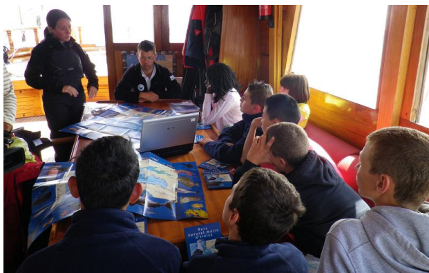
Photo : Les Matelots de la Vie à l'écoute

Ces missions, nos matelots le comprennent, sont essentielles à la protection de notre environnement, à la bonne santé de la nature et aussi à celle des êtres humains !