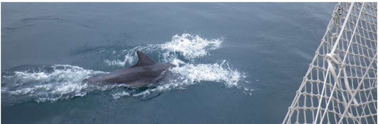
Photo : Un dauphin arrive jouer à l'étrave