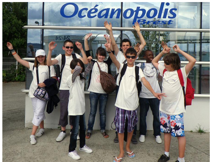
Photo : Les matelots arrivent à Océanopolis