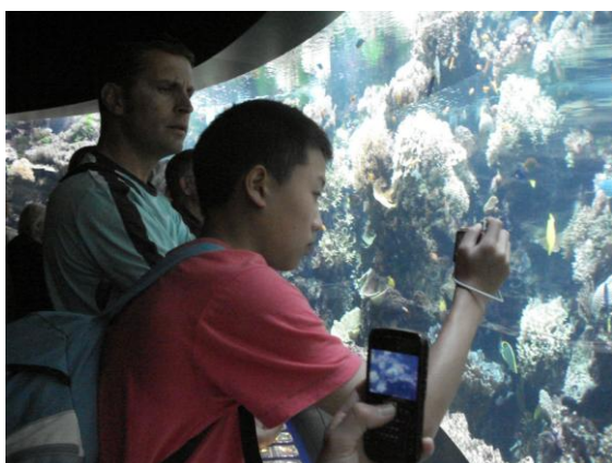
Photo : Les matelots en reportage photo à Océanopolis