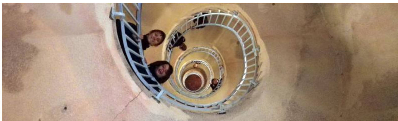
Photo : Les matelots à l'ascension du phare de Lanidut