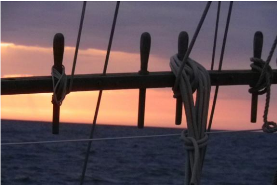
Photo : Lever de soleil

Puis se fut l'heure des adieux, le Bora Bora reprend la mer. Il est reparti comme il est arrivé, admiré par la foule. Les matelots ont le cœur gros de quitter cette ambiance mais ils ont aussi hâte de retrouver la mer!!