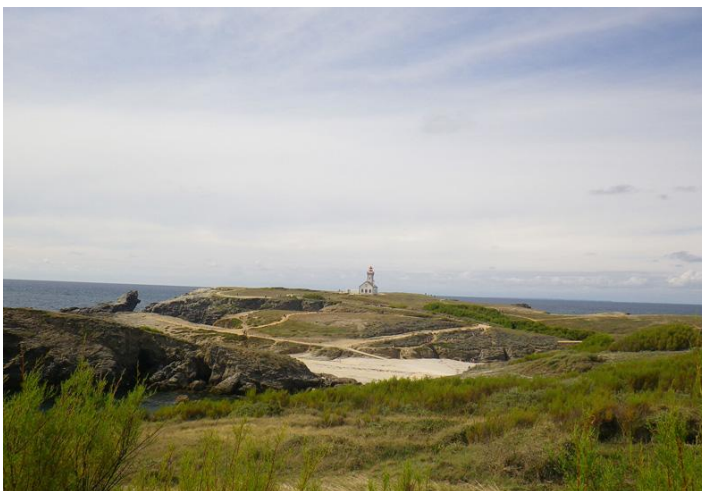
Photo : CloseLa pointe des Poulains à Belle Ile