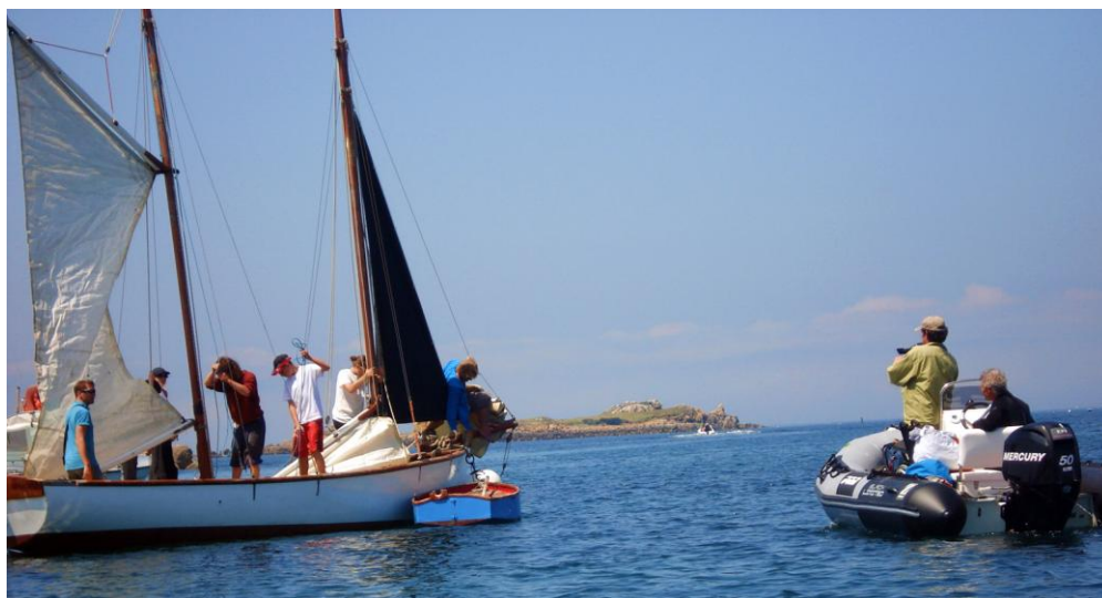
Photo : Les Matelots de la Vie préparent leur Loup (petit voilier traditionnel, prêté par l'AJD)