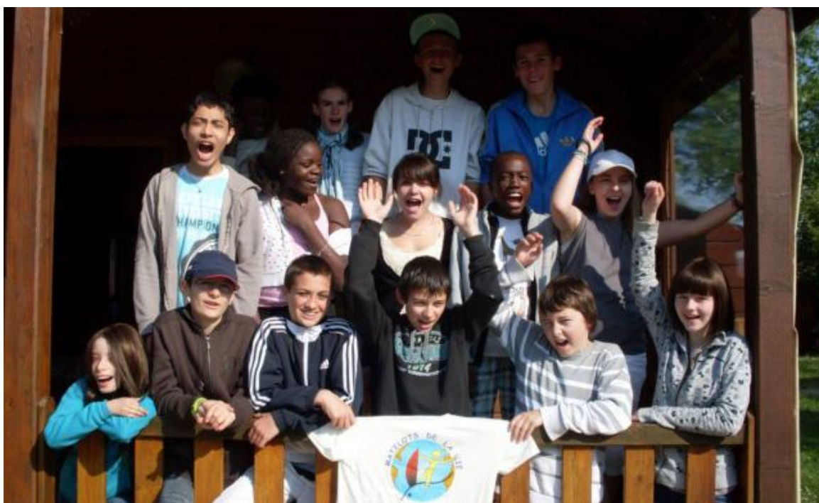
Photo : Equipage des Matelots de la Vie 2011 lors du stage d'avril 2011

----- Vendredi 22 au Mardi 26 avril 2011 : Seize jeunes en rémission de maladies graves sélectionnés par leur hôpital pour composer les équipages 2011 des « Matelots de la Vie » se retrouvent en Pays de Loire pour un stage de quatre jours.