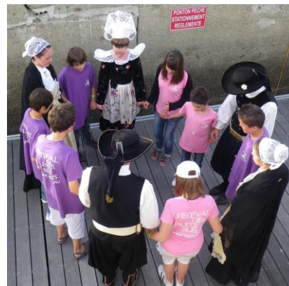
Photo : A la danse bretonne...