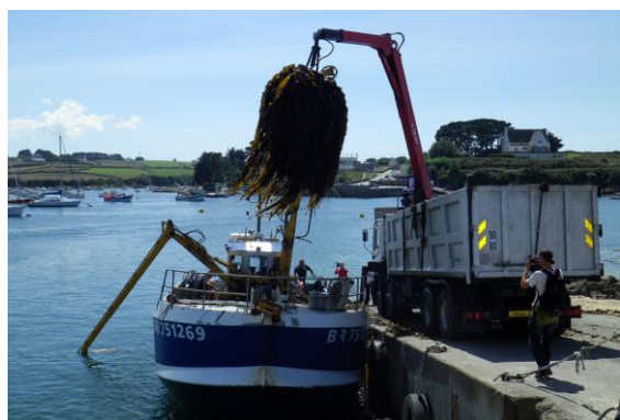
Photo : Un goémonier au retour de pêche

9 août... Au réveil les matelots relèvent le filet posé la veille