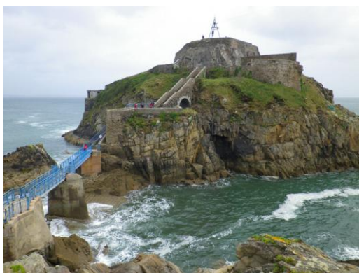
Photo : Le Fort de Berthaume

14 juillet... Encore une journée de grand soleil en Bretagne ! Les matelots empruntent à nouveau les Loups de mer de l'association « Les Amis du Jeudi-Dimanche ». Cap sur l'île Stagadon (à l'entrée de l'Aber Wrac'h). Après une navigation mouvementée, non pas à cause de la météo, fort belle, mais parce que les deux équipages se sont affrontés en réglages de voile, finesse de toucher de barre et options tactiques afin de déterminer qui, des deux Loups, était le meilleur régatier... Mais bon, il n'y a pas eu de vrai gagnant, chaque équipage ayant choisi une ligne d'arrivée différente !!!